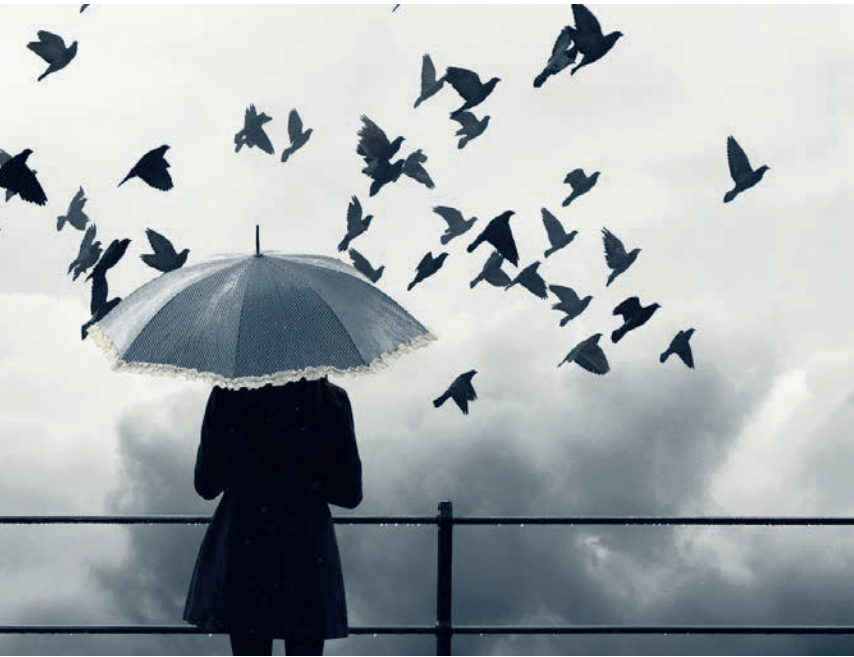
Einsamkeit ist so schädlich, wie das Rauchen von täglich 15 Zigaretten.

keit: das subjektive Empfinden von Einsamkeit und die tatsächliche soziale Isolation. Dabei ist das Gefühl eine Frage der individuellen Betrachtung. Nicht jeder der allein ist, ist gleich einsam – und umgekehrt.